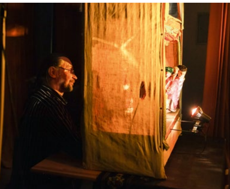
Представление театра «Бродячий вертеп» (г. Москва)