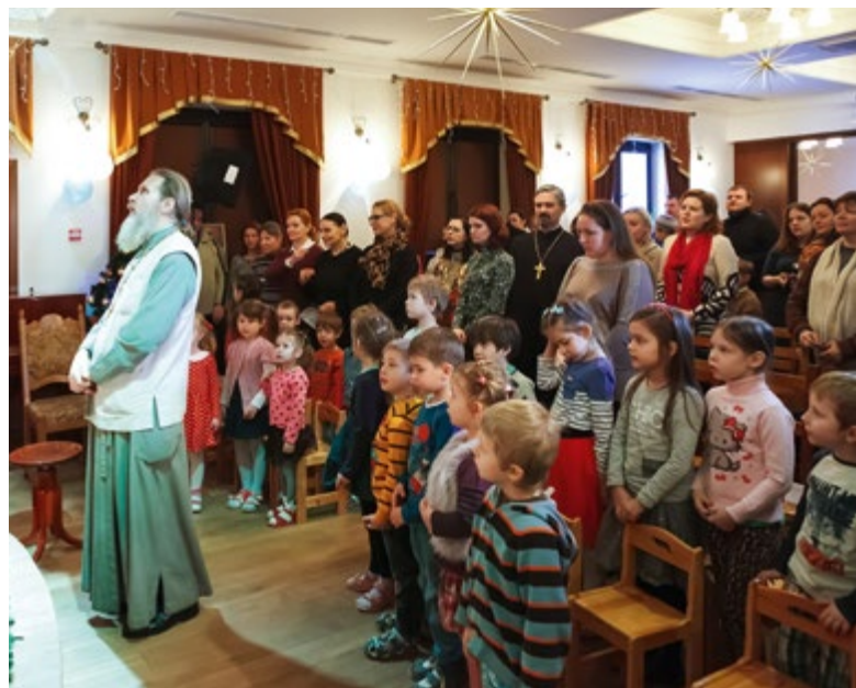
Молитва в день открытия фестиваля