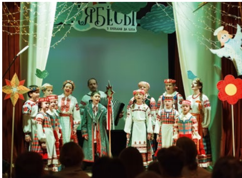
Выступление детского ансамбля