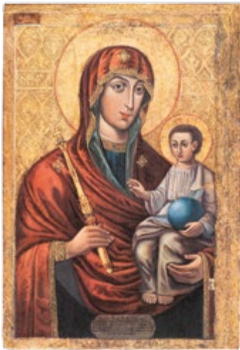
Икона Божией Матери «Минская» 13/26 августа

Издается по благословению Высокопреосвященного ПАВЛА, митрополита Минского и Заславского, Патриаршего Экзарха всея Беларуси