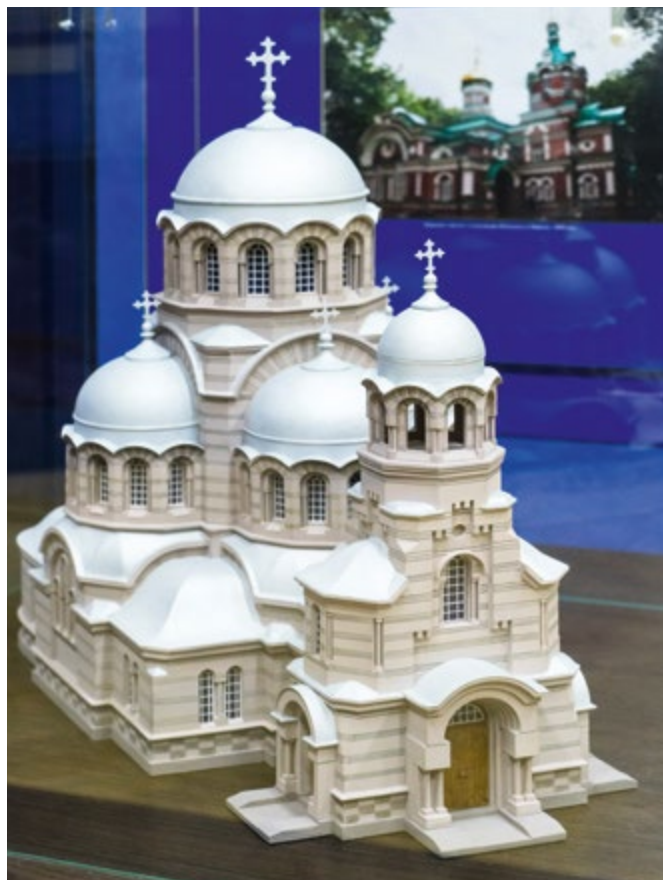
Макет храма в честь иконы Божией Матери «Казанская». Располагался в городе Минске недалеко от железнодорожного вокзала с 1912 по 1936 годы

На стендах в этом зале размещены фото храмов, которые были разрушены, здесь же хранятся рукописи (когда люди переписывали Священное Писание и другие духовные книги), представлен материал, свидетельствующий о жизни Церкви в годы Великой Отечественной войны. Во время экскурсии мы часто показываем фильмы, посвященные истории Церкви и жизни святых. Обычно посетители музея смотрят киноленту «Храм», снятую к празднованию 1000-летия Крещения Руси и отражающую жизнь и приоритеты Церкви в 1987 году. Некоторых посетителей привлекает стенд, на котором размещены церковные награды. Их получают те, кто внес значимый вклад в церковную жизнь. В основном, эти награды посвящены белорусским святым».