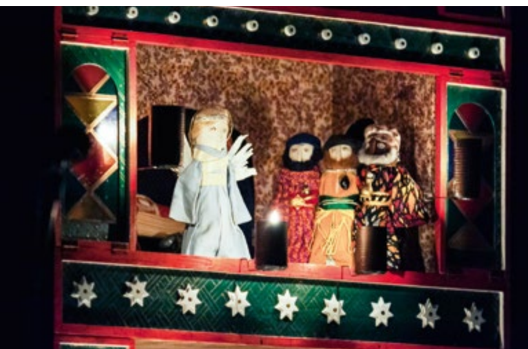
Спектакль «Смерть царя Ирода» (театр «Бродячий вертеп», г. Москва)