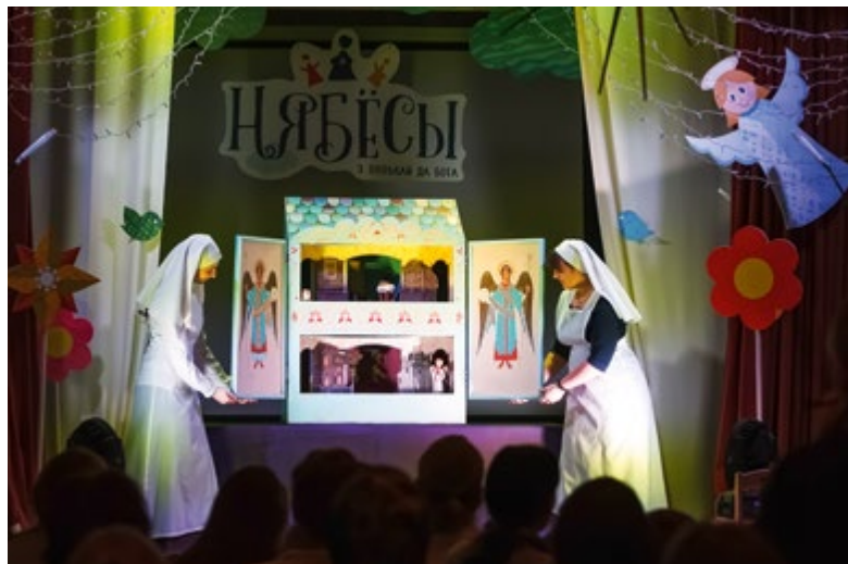
Выступление театра «Батлейка» Елисаветинского монастыря