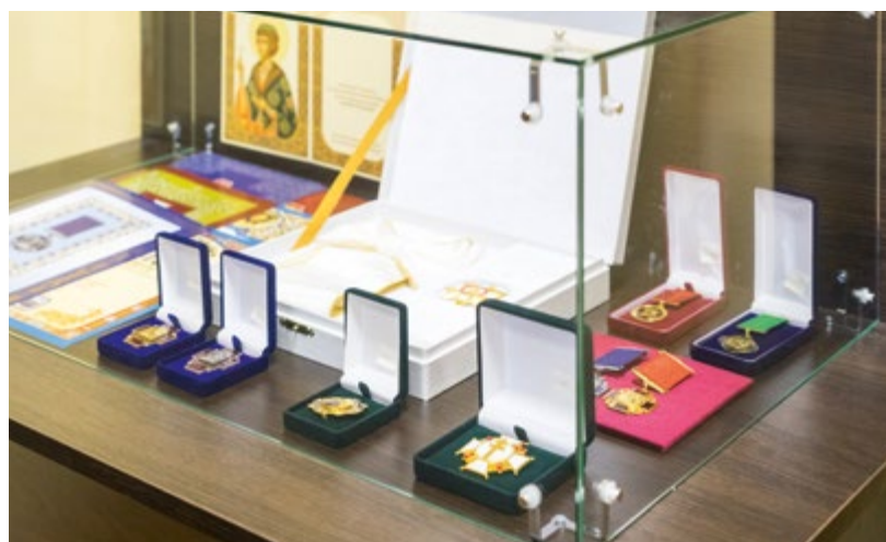
Внебогослужбные награды БПЦ

Здесь есть и образцы книгопечатания тех времен, когда оно еще только зарождалось, а также все виды церковного облачения. Что касается последних, то в ходе экскурсии я стараюсь как можно подробнее рас-