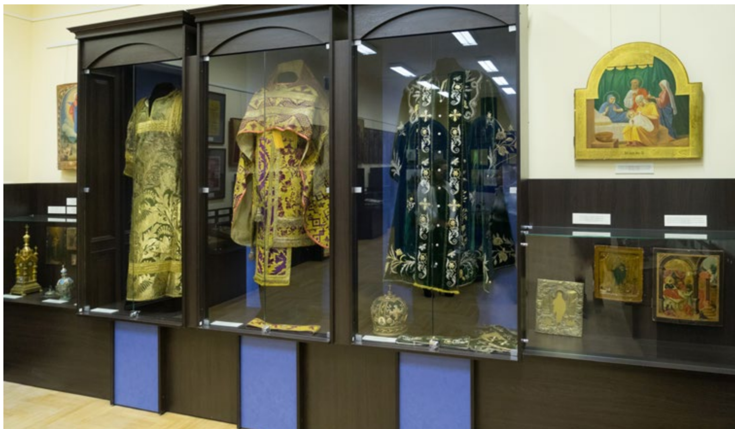
Богослужebные облачения. XIX век. Синий зал