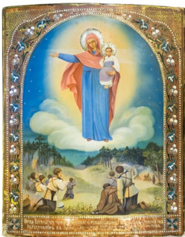
Икона Божией Матери «Августовская». 20-е годы XX века