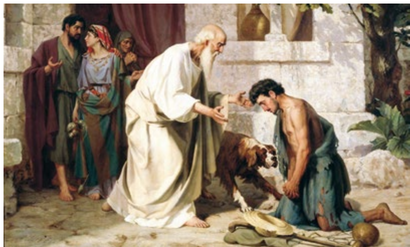
Притча о блудном сыне. Н. Лосев, 1882 г.

Но помимо прямого смысла, Св. Писание часто имеет другой, таинственный, скрытый смысл. И надо вам понять, какой же иной смысл имеет этот 136-й псалом для нас, христиан. И почему поется он в дни, подготовительные к Великому посту. В плен языческий, в плен к людям нечестивым и жестоким попал народ иудейский. А мы, забывающие Бога, все находимся в плену, в плену еще гораздо более тяжком, — в плену у врага рода человеческого, который стремится нас погу-