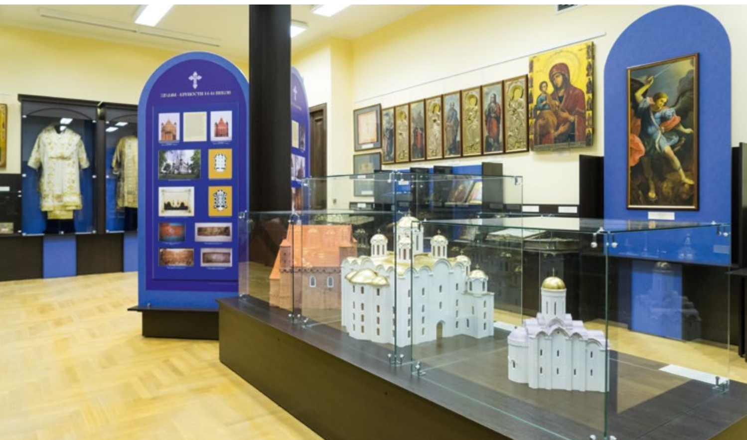
Общий вид Синего зала

сказать, в чем отличие того или иного одеяния от другого. Ведь наш музей посещают не только воцерковленные люди, но и те, кто мало знает о Православной Церкви. В церковном облачении много сложных, непонятных для большинства мирян элементов, и каждая деталь имеет свое значение и свою историю происхождения. Когда меня спрашивают во время экскурсии, почему нельзя сделать древние церковные традиции понятными, как-то адаптировать под современность, я всегда предлагаю посмотреть на икону Христа Спасителя и обратить внимание на Его одеяние. Фиолетовая одежда значит, что Он глава государства, золотая лента на правом плече — что Он является военачальником армии. А если мысленно переодеть Его в привычные для нас одежды главы государства и военачальника армии, вы сможете молиться на такую икону? Ответ всегда отрицательный.