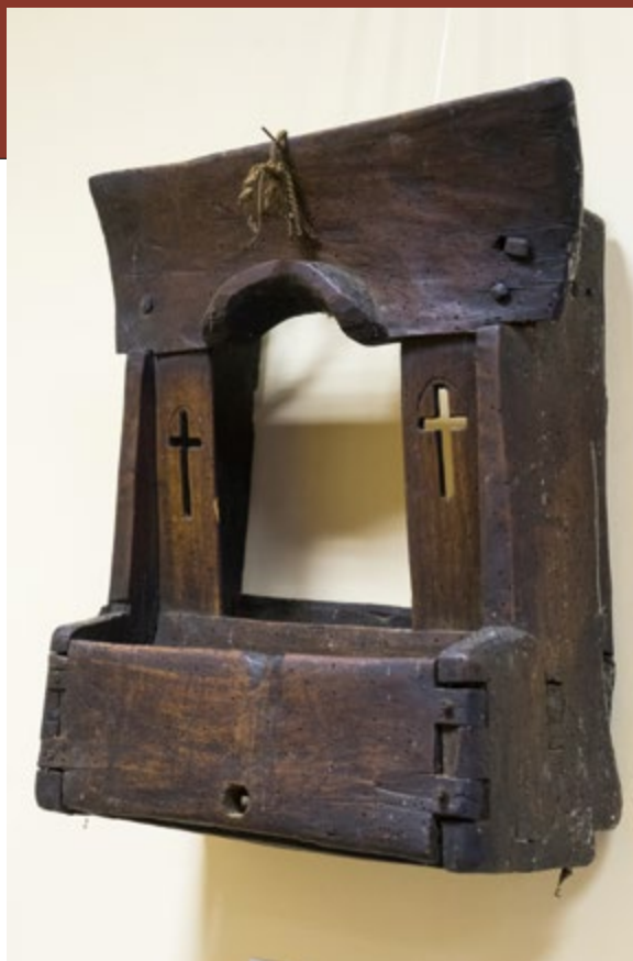
Оклад от иконы-свечи. 20-е годы XX века.

В 2013 году на заседании Синода Белорусской Православной Церкви было принято решение о создании Церковно-исторического музея при Минской духовной академии. Тогда еще это учебное заведение располагалось в агрогородке Жировичи, поэтому музей создавался на базе Духовно-образовательного центра по инициативе митрополита Минского и Слуцкого Филарета, ныне Почетного Патриаршего Экзарха всея Беларуси. В основу музейной экспозиции легла коллекция предметов, связанных с историей Церкви, собранная владыкой Филаретом за время пребывания Его Высокопреосвященства на Минской кафедре.