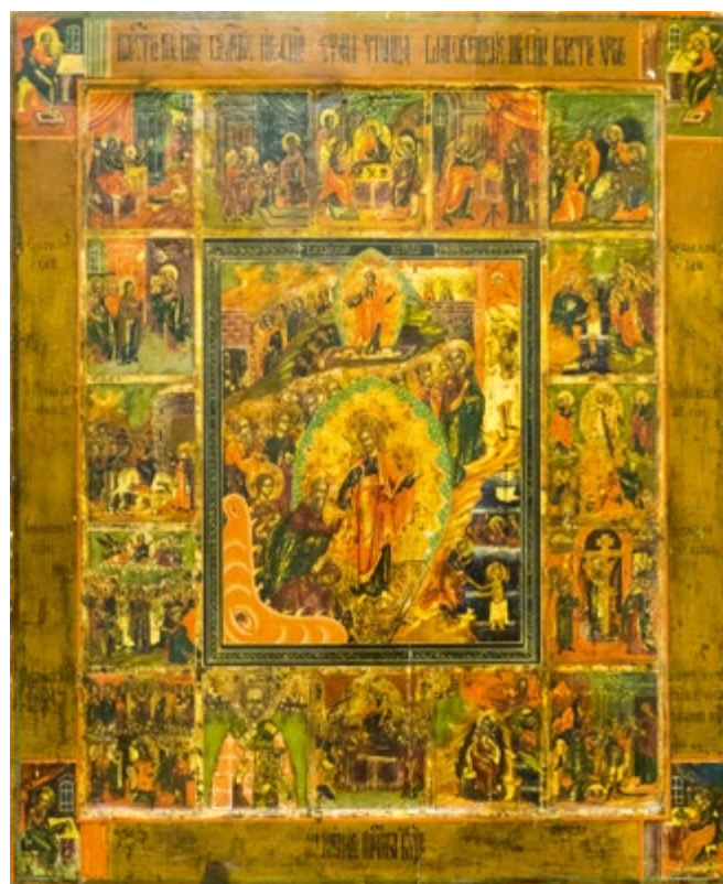
Икона «Воскресение Христово с двенадцатыми праздниками». XIX век, старообрядческие мастерские

В Синем зале также можно увидеть уникальную коллекцию нательных крестов, которую собирал владыка Филарет с особым рвением. Некоторые из них он лично выкупал в антикварных салонах. Известно,